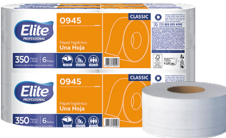
Elite Papel Higiénico Classic Una hoja, económico. Tráfico medio. Color blanco. 6 rollos de 350 metros.