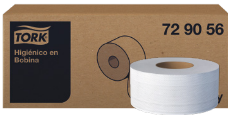
Tork Higiénico en Bobina Universal Color blanco. 12 rollos de 180 metros.

Papeles de mayor suavidad. Diseños que cubren las necesidades básicas de higiene en baños. Empaques y tamaños que facilitan la transportación y almacenamiento que contribuyen a reducir costos