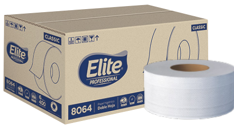
Elite Higiénico Blanco Doble hoja, tráfico alto, gofrado rombo. Color blanco. 6 rollos de 400 metros.