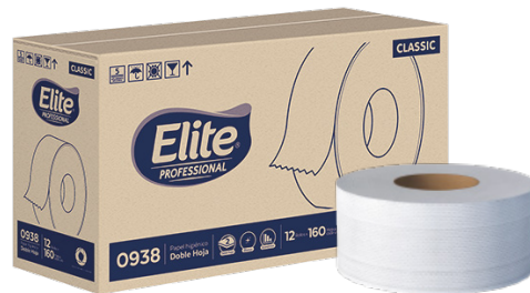
Elite Papel Higiénico Classic Doble hoja, gofrado nubes. Económico Color blanco. 12 rollos de 160 metros.