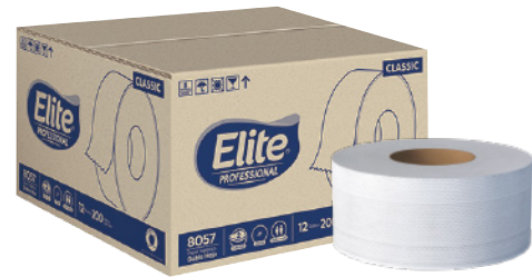
Elite Higiénico Hoja Doble Hoja doble, tráfico medio, gofrado rombo. Color blanco. 12 rollos de 200 metros.